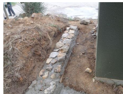
Mise en place de la deuxième rangée de pierres.

IDEAL - Initiatives Développement Emploi Aude Littoral - Parc d'Activités de La Coupe - 9 rue Nicolas Leblanc - 11100 Narbonne