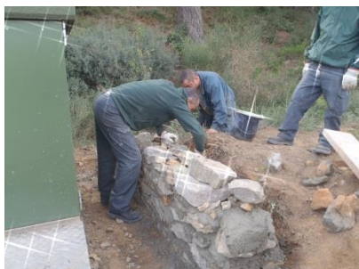
Scellement de pierres au mortier.