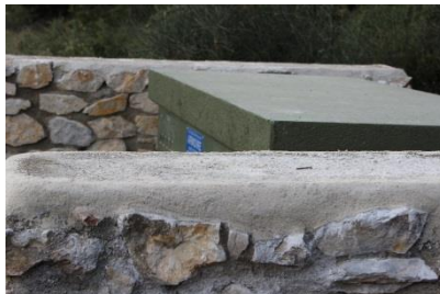
Les arases terminées.