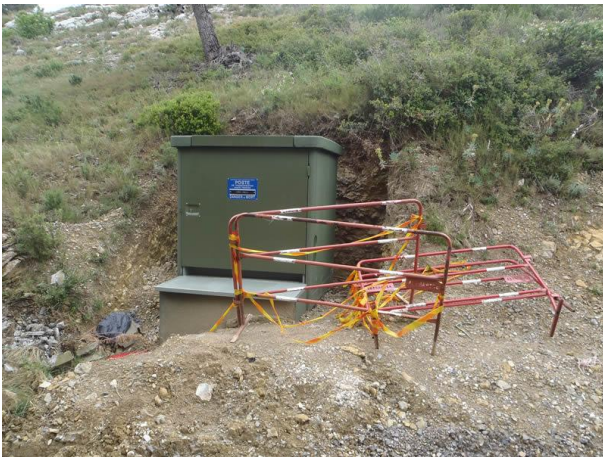
Transformateur avant travaux.