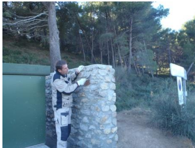
Finition des joints à la brosse métallique.