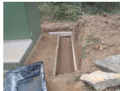
Fabrication du coffrage de fondation.