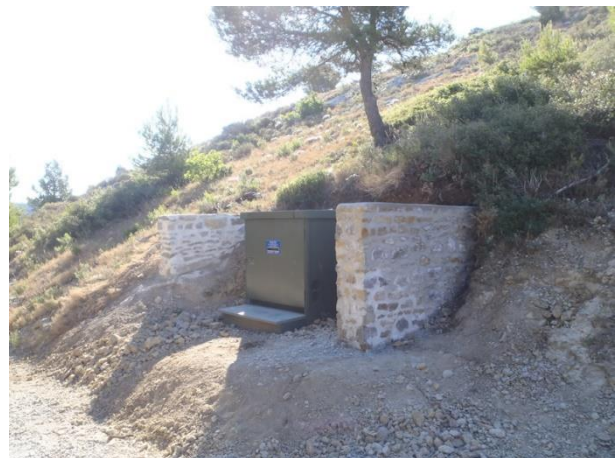
Transformateur après l'intervention de l'équipe d'IDEAL

IDEAL - Initiatives Développement Emploi Aude Littoral - Parc d'Activités de La Coupe - 9 rue Nicolas Leblanc - 11100 Narbonne