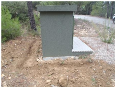
Creusement de la fouille de fondation.