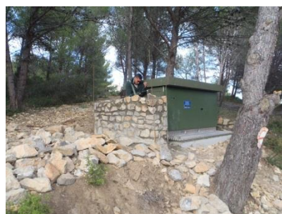
Dernière rangée de pierres