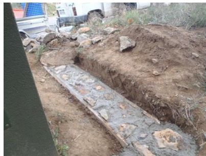
Positionnement du premier rang de pierres dans le béton frais.