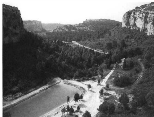
Photo 1 : Le site du Rec d'Argent dans le massif de la Clape (Bassin DFCI)

Son paysage typique est composé d'une succession de plateaux rocheux séparés par d'étroits ravins, où la garrigue basse domine.