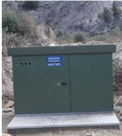
Transformateur avant travaux.