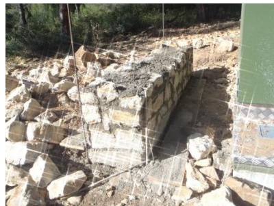
Muret en cours de montage.