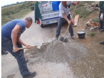
Préparation du béton de fondation.

IDEAL - Initiatives Développement Emploi Aude Littoral - Parc d'Activités de La Coupe - 9 rue Nicolas Leblanc - 11100 Narbonne