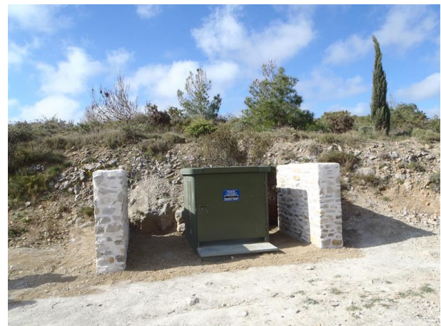
Transformateur après l'intervention de l'équipe d'IDEAL

IDEAL - Initiatives Développement Emploi Aude Littoral - Parc d'Activités de La Coupe - 9 rue Nicolas Leblanc - 11100 Narbonne