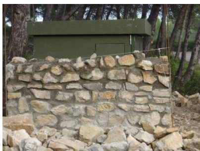
Réalisation des joints.

IDEAL - Initiatives Développement Emploi Aude Littoral - Parc d'Activités de La Coupe - 9 rue Nicolas Leblanc - 11100 Narbonne