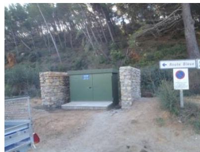
Vue d'ensemble des murets finis

IDEAL - Initiatives Développement Emploi Aude Littoral - Parc d'Activités de La Coupe - 9 rue Nicolas Leblanc - 11100 Narbonne