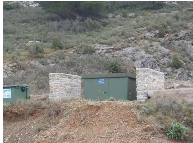
Transformateur après l'intervention de l'équipe d'IDEAL.

IDEAL - Initiatives Développement Emploi Aude Littoral - Parc d'Activités de La Coupe - 9 rue Nicolas Leblanc - 11100 Narbonne