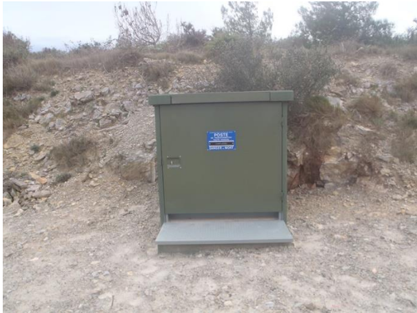
Transformateur avant travaux.