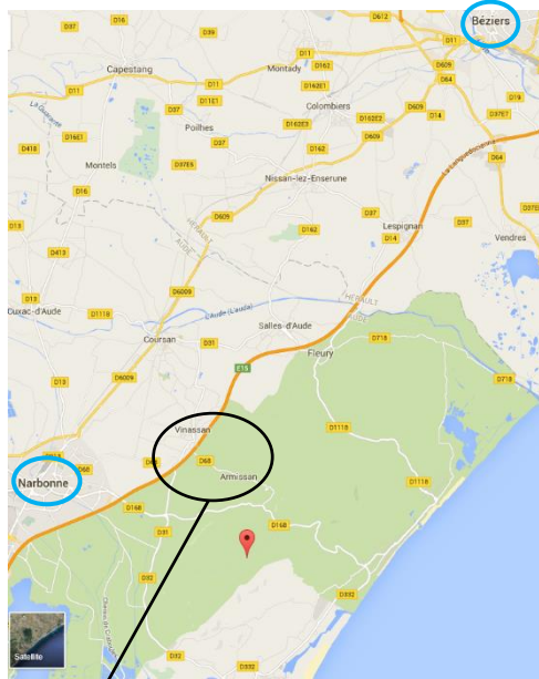
Vue aérienne du site