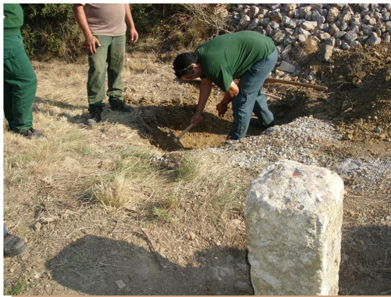
Début des fouilles